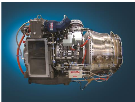
Turbina de Gas Vericor TF50F

Jereh seleccionó la turbina de Gas Vericor TF50F™ debido a su probado diseño aeroderivado, configuradas específicamente para aplicaciones de accionamiento mecánico. Las ventajas de usar estos sistemas con turbinas de gas, para aplicaciones de accionamiento mecánico son múltiples: