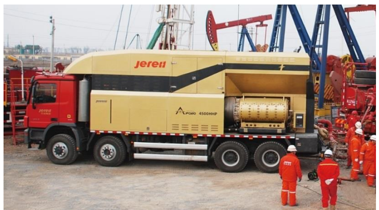
El Remolque de Fracturación Hidráulica Apolo 1 en Pruebas de Campo