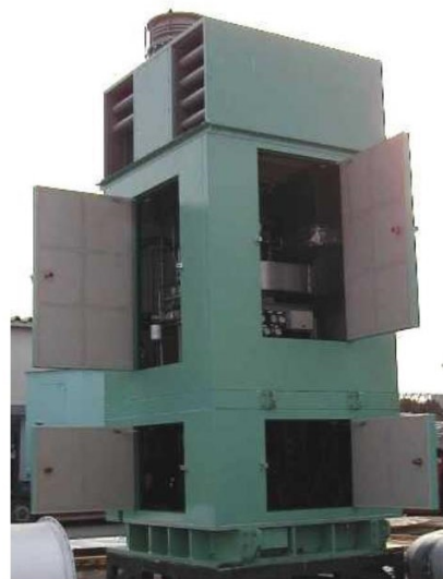
ASE40V 燃气轮机驱动一个立式泵，快速移走台风期间的洪水